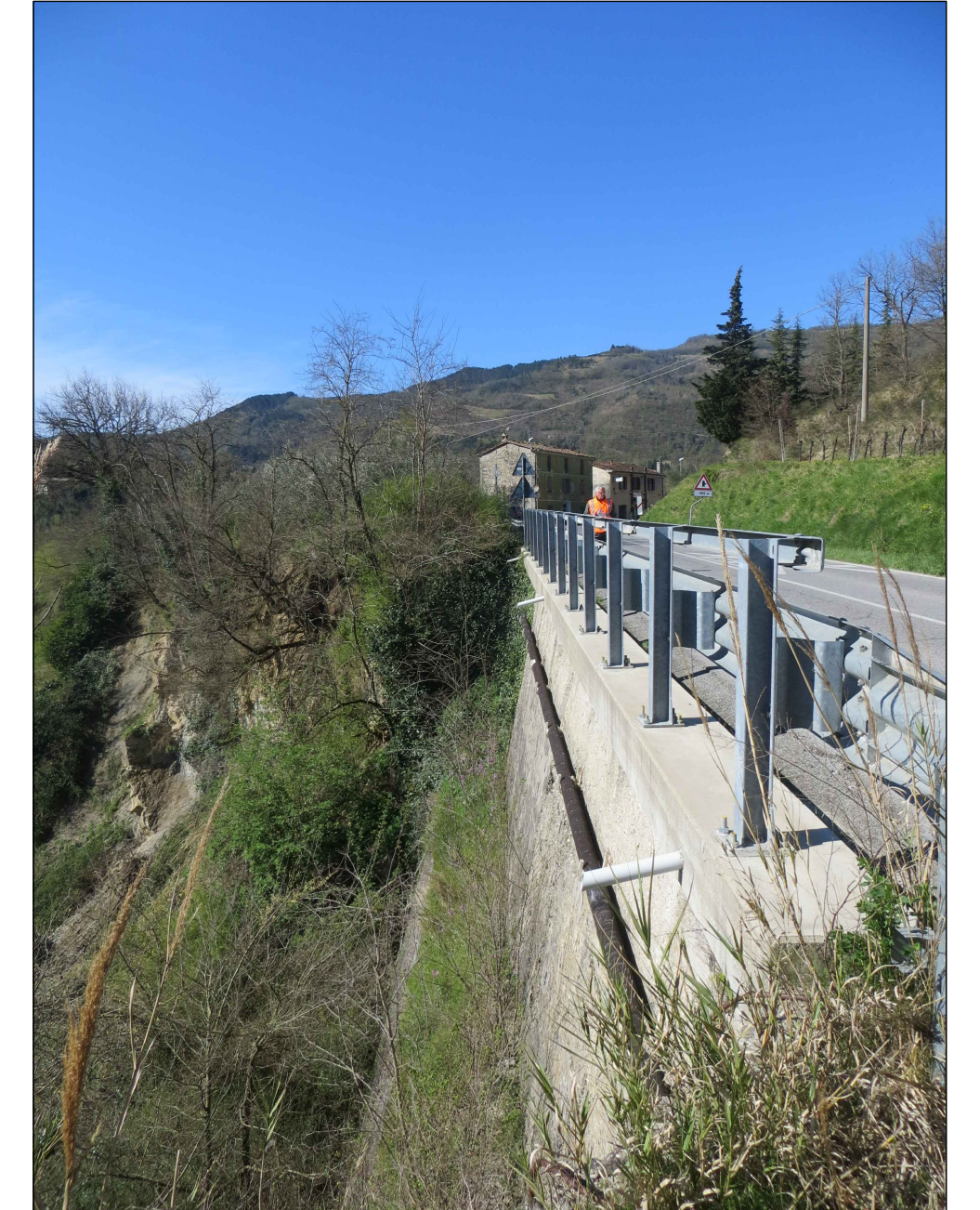
FOTO - Tratto di gasdotto ancorato esternamente al muro esistente

NOTE GENERALI Tutte le dimensioni sono espresse in centimetri, tutte le misure degli angoli sono espresse in gradi sessagesimali, tutte le quote altimetriche sono espresse in metri, (salvo dove diversamente indicato). Le quote di scavo e la posizione degli interventi, nonché le dimensioni degli elementi indicati, dovranno essere verificate sul posto dall'impresa esecutrice dei lavori e se necessario, sentita la D.L., andranno opportunamente adeguata all'effettiva morfologia del terreno. Le coordinate assolute di tracciamento si riferiscono al sistema di riferimento fornito con rilievo dato dal committente sono nel sistema di riferimento Gauss Boaga WGS84 UTM fuso 33. Il rilievo dello stato attuale è stato eseguito da Atlantia. Prima dell'inizio delle lavorazioni dovrà essere verificato lo stato di conservazione e di integrità delle strutture esistenti. In caso di strutture compromesse o danneggiate, procedere ripristino delle stesse, previo giudizio insindacabile della D.L.